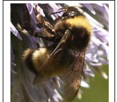
Bourdon terricole ( Bombus terrestris )

Ces efforts favoriseront la survie et la santé des populations de nos abeilles sauvages, qui font face depuis plusieurs années à différentes menaces. Ces dernières ont mené au déclin de quelques espèces, dont notamment le bourdon terricole