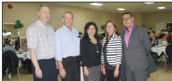
Table festive à Chibougamau

Le mercredi 15 octobre, de 7 h à 10 h, les employés et dirigeants ont mis la main à la pâte et ont servi 170 déjeuners aux membres de la Caisse à la salle communautaire de Chapais. Les membres ont également pu profiter du moment pour assister à une exposition des œuvres d'artistes locaux.