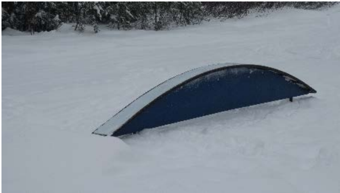
Module « Rainbow box »

Le module « Rainbow box » est comme son nom l'indique arqué comme un arc en ciel : il est d'une hauteur de 3pi et sa surface de glisse est elle aussi de 16pi. Ce module demande une maîtrise un peu plus avancée, mais est un bon compromis entre la sécurité et le défi.