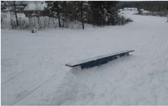
Module « Butter box »

autant pour les débutants que ceux qui sont plus habitués à ce type d'acrobatie.