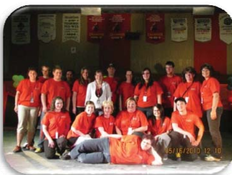
Comité en 2010