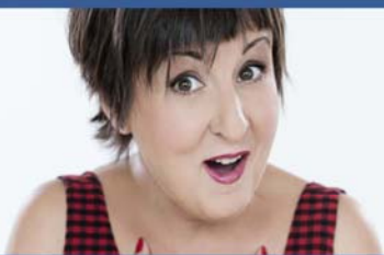
SOUPER-SPECTACLE MARIE-LISE PILOTE Humoriste et entrepreneure

DATE LIMITE D'INSCRIPTION: 8 NOVEMBRE 2013